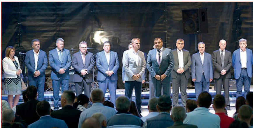
Сцената на градския площад в Мадан по традиция се изпълни от официални лица – домакини и гости на празника, провел се 24 август

С напълно обновен площад - красиви цветни плочки, осветление, фонтан, нови тротоарни настилки и оформените зелени кътове, детски площадки, кътове за отход и др., жители и гости на Мадан посрещнаха традиционния празник на града и Деня на миньора.