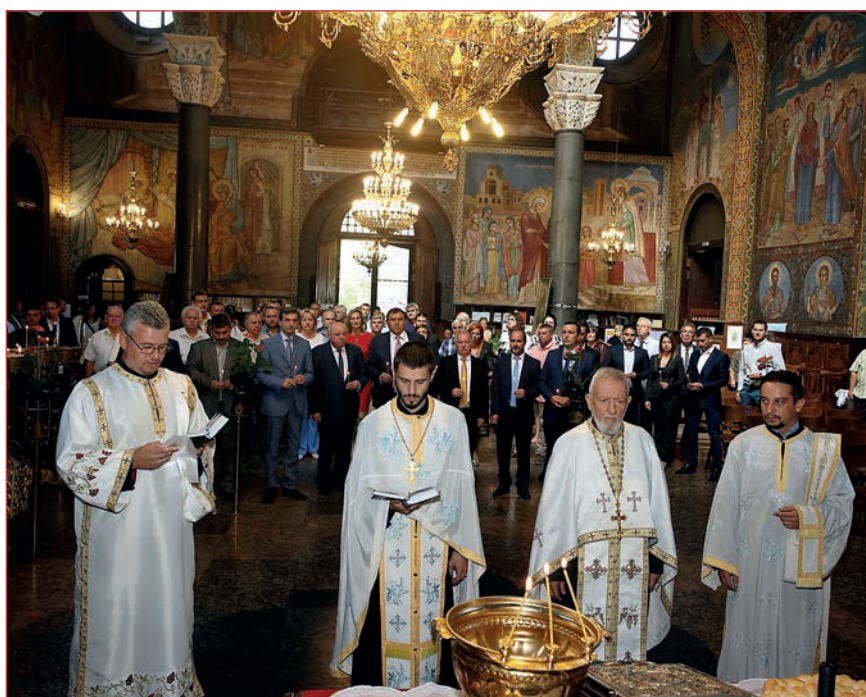
Преди тържественото събрание в Катедралния храм „Св. Неделя“ бе отслужен молебен за здраве на миньорите

Официални гости на честването бяха министърът на енергетиката – Теменужка Петкова, министърът на труда и социалната политика - Бисер Петков, заместник-министрите Кра-