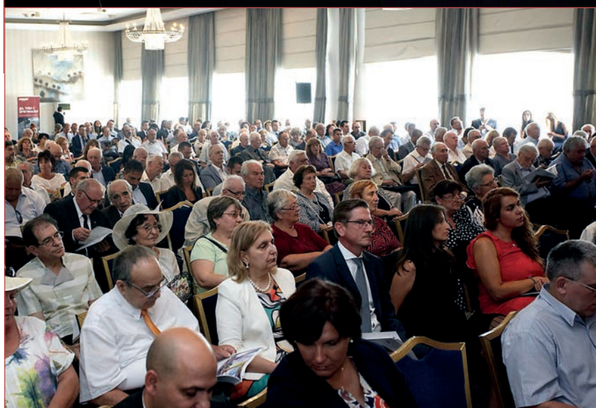
Официалният президиум и част от аудиторията по време на националното честване на Деня на миньора в София Хотел Балкан

симир Първанов, Жечо Станков, Лъчезар Борисов, Красимир Живков, представители на синдикалните организации в страната, на академичната и научна общност, областни управители и кметове, представители на дипломатически мисии, неправителствени организации и меди.