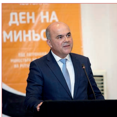
БИСЕР ПЕТКОВ - МИНИСТЪР НА ТРУДА И СОЦИАЛНАТА ПОЛИТИКА