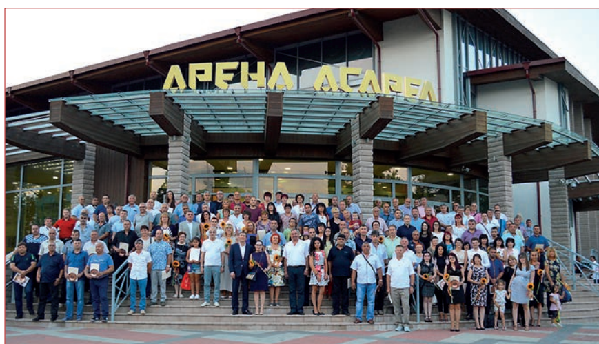
Двеста работници, служители и мениджъри от „Асарел-Медет“ АД бяха отличени за професионалните си постижения или дългогодишната си трудова кариера