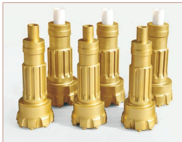
„Геотрейдинг“ АД разшири портфолиото си с нов продукт, предназначен за добивните компании

SHAREATE TOOLS LTD. е световно признат китайски производител на продукти с широко приложение в минната индустрия - пробивни инструменти, триролко-