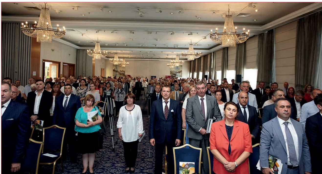
На събитието присъстваха над 400 гости, свързани с минералносуровинния бранш

На 17 август, Ден по-рано, българската минна общност отбеляза своя професионален празник – Деня на миньора. Официалното честване се състоя в София Хотел Балкан, където по традиция се събират стотици представители на минералносуровинната индустрия в България. То се организира ежегодно от Българска минно-геоложка камара, Научно-технически съюз по минно дело и геология, Федерация на независимите синдикати на миньорите и Синдикална миньорска федерация „Подкрепа“ и се провежда под патронажа на министъра на енергетиката на Република България Теменужка Петкова. Спонсори на събитието бяха „Асарел-Медет“ АД, „Геотехмин“ ООД „Дънди Прешъс Металс“ ЕАД, и „Минстрой Холдинг“ АД.