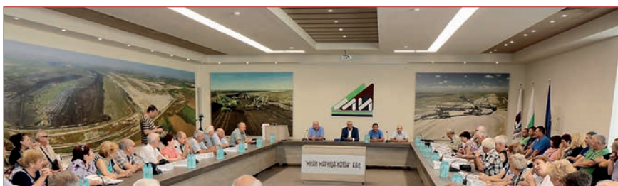
Среща на ръководството на „Мини Марица-изток“ ЕАД с представители на Клуб на миньорите-ветерани

борите на трите рудника и на управлението на дружеството, а в полувремената състезатели от трите рудника премериха сили по дърпане на въже.