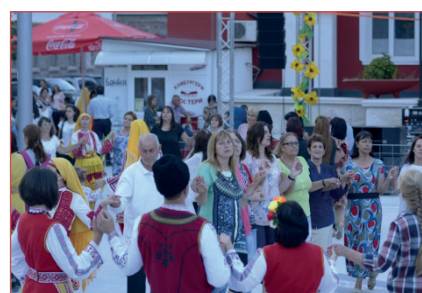
Празненствата се провеждат в обновения център на Мадан