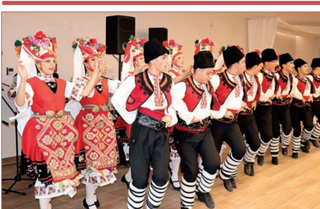
Фолклорният ансамбъл „Балканска младост“ се грижеше за доброто настроение на гостите