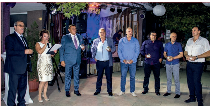
Церемонията по връчването на наградите на тържеството на „Горубсо-Златоград“

С гордост от постигнатите добри производствени резултати и много настроение „Горубсо-Златоград“ АД отбеляза Деня на