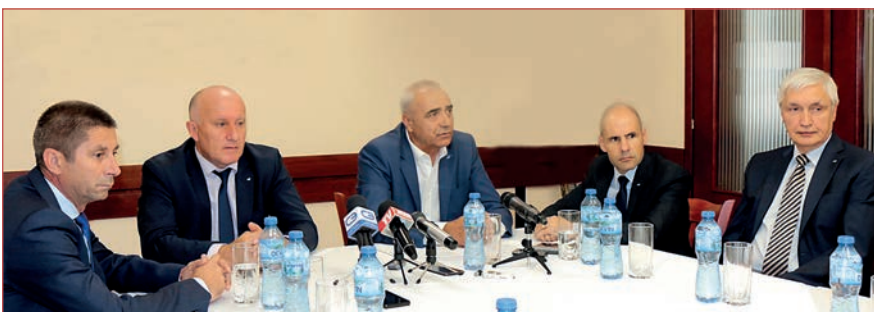
Мениджърският екип на „Мини Марица-изток“ ЕАД по време на пресконференцията, проведена на 13.08.2018 г.