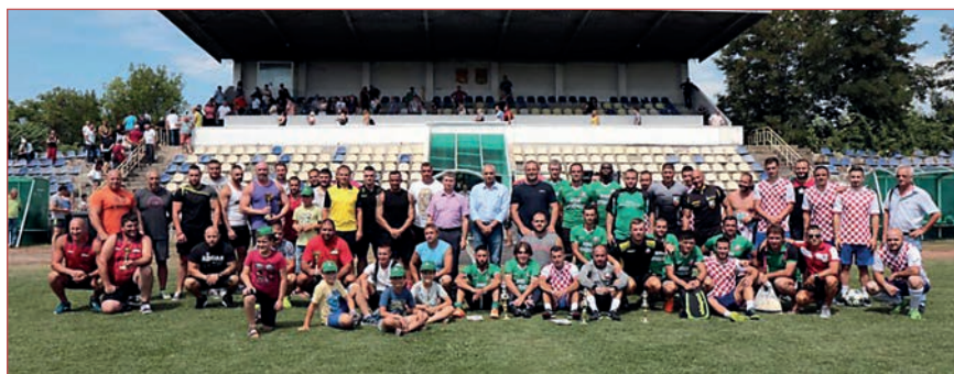
Надпреварата във футболния турнир между отборите на трите рудника и управлението премина в спортменски дух и партньорство

Спортната програмата по случай Деня на миньора продължи и на 15 август с турнир по футбол на малки вратички на стадион „Миньор“ в гр. Раднево. Надпреварата премина в спортменски дух и партньорство. Футболният турнир беше между от-