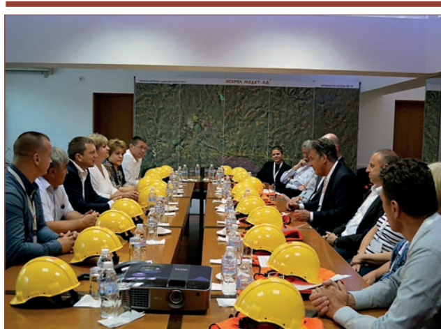
Гостите от „Аурубис“ и ръководството на „Асарел Медет“ АД по време на работната среща

В края на посещението гостите от „Аурубис“ изразиха възхищение от видяното, като споделиха, че в „Асарел-Медет“ АД оборудването и технологиите са на световно ниво.