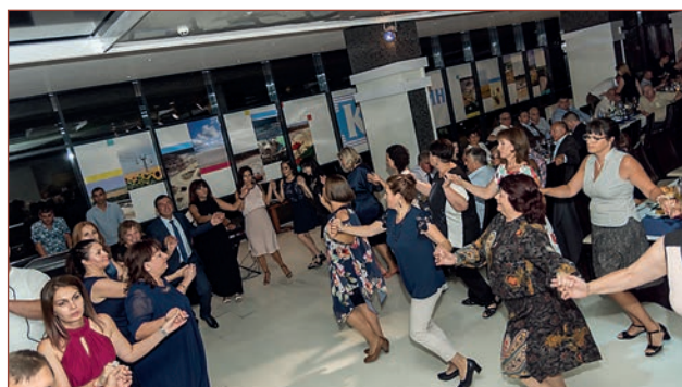
Служители на „Каолин“ ЕАД и гости се забавляваха на празничния бал по случай Деня на миньора