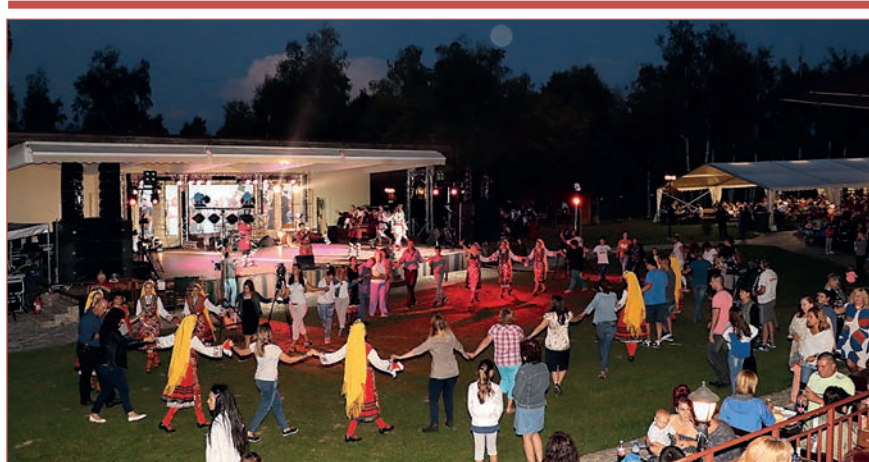
Празникът в Челопеч продължи до късно през нощта

По повод Деня на миньора „Дънди Прешъс Металс Челопеч“ ЕАД организира празник за своите служители. След двугодишно прекъсване тържеството се проведе на 17 август в парк Корминеш край село Челопеч. Водещ акцент в цялостната организация беше българския фолклор и традиции.